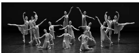
『シンフォニエッタ』(『第6期生・第7期生合同発表会』より)