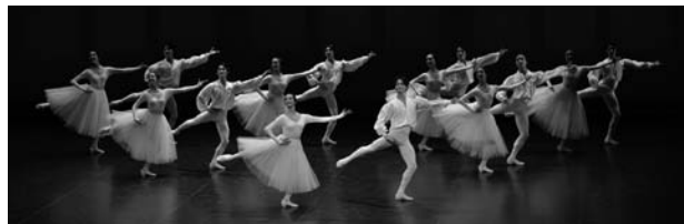
『キャラクター・ダンス』