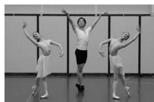
『海と真珠』(ヴァリエーション発表会より)