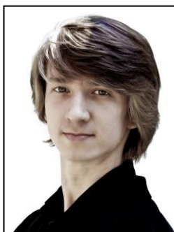
ワディム・ムンタギロフ (8、11日) (シーズンゲストダンサー) (英国ロイヤル・バレエ プリンシパル)