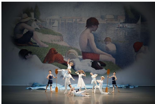
新国立劇場バレエ研修所