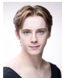
ジョージ・ エドワーズ