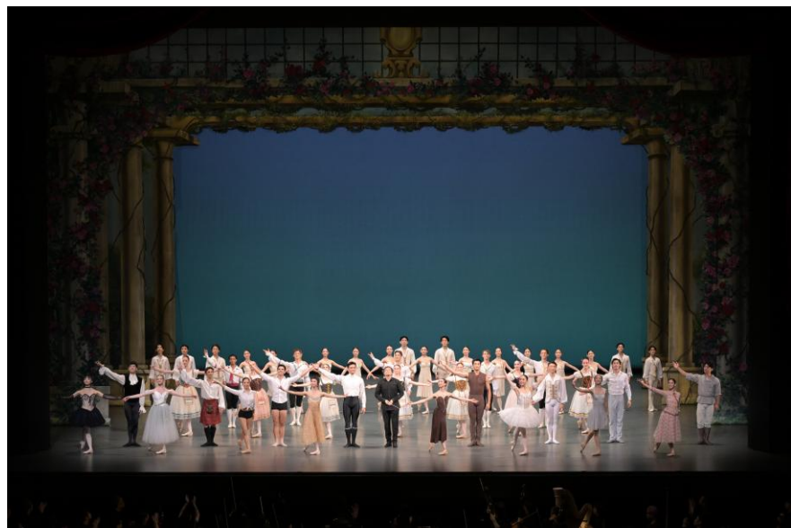
「バレエ・アステラス 2025」より カーテンコール

16回目の開催となる2026年は、 8か国8バレエ団から16名のダンサー が出演。人気の古典バレエの名作から日本初演の現代作品まで、多彩なプログラムを上演、日本人ダンサーが活躍する世界のバレエ界の「今」をお届けいたします。