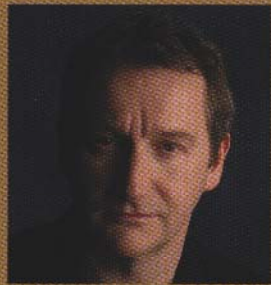
演出・振付：デヴィッド・ビントレー

2010年5月1日(土)、2日(日)、3日(月・祝)、4日(火・祝)、5日(水・祝)