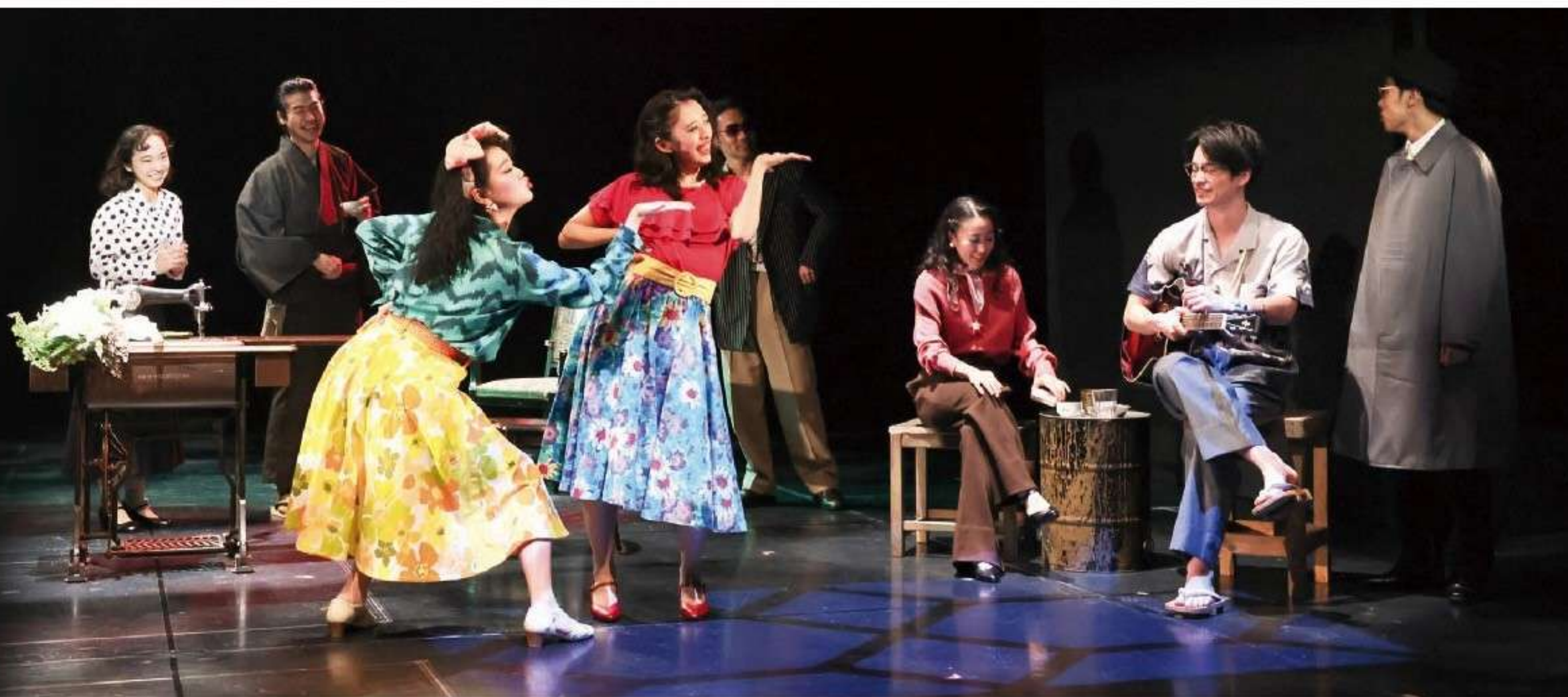
第19期生公演『トミイのスカートからミシンがとびだした話』

20代後半で入所しましたが、この時間がなければ今の自分はありません。演技だけでなく、仲間と向き合う中で、自分自身とも向き合えました。どう過ごすかは自分次第。だからこそ、得られるものは大きいと思います。