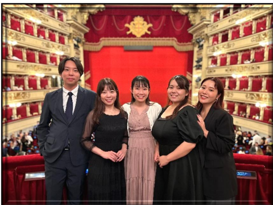
2024年9月 ミラノ・スカラ座アカデミー海外研修

新国立劇場オペラスタジオは「世界を目指すオペラ歌手」にとって、まさに「世界への滑走路」と言えるでしょう。 グローバルな活躍を目指す多くの若いオペラ歌手の挑戦を心よりお待ちしております。