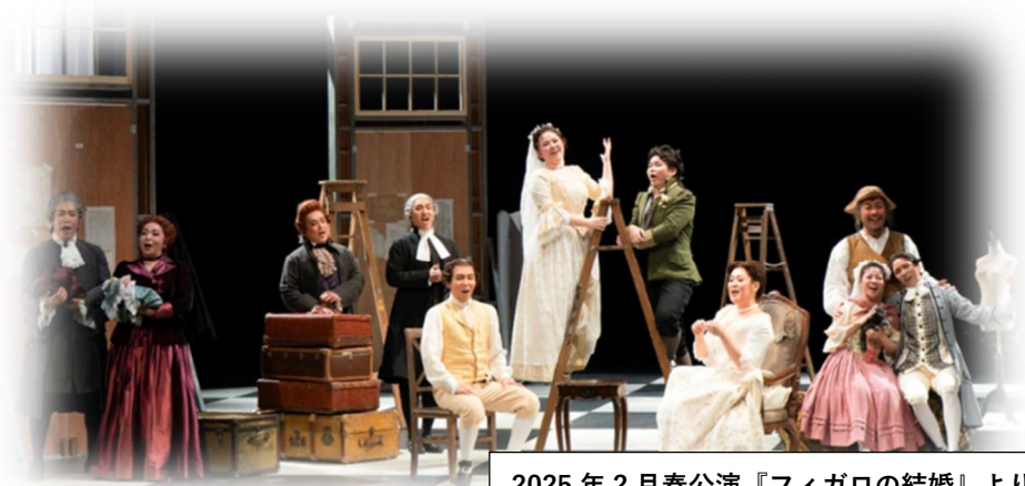
2025 年 2 月春公演『フィガロの結婚』より