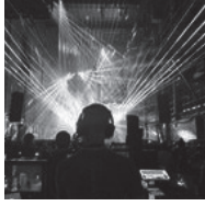
映像 WEIRD CORE Video: WEIRD CORE

ロンドンを拠点に活動。音楽シーンの最先端アーティストのためのビジュアルを主に手掛けている。画期的なビデオ、インスタレーションなどを手がけ世界中のオーディエンスを魅了している。プログラミングなど最先端テクノロジーをも操作して、三次元の多感覚体験を生み出している。最近ではエイフェックス・ツインとのコラボレーションによる NFT『/afx¥/weirdcore¥』は大きな話題を集めている。新国立劇場初登場。 http://weirdcore.tv/