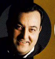
ドゥルカマラー レナート・ジローラミ