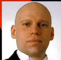
指揮 ジュリアン・サラムール