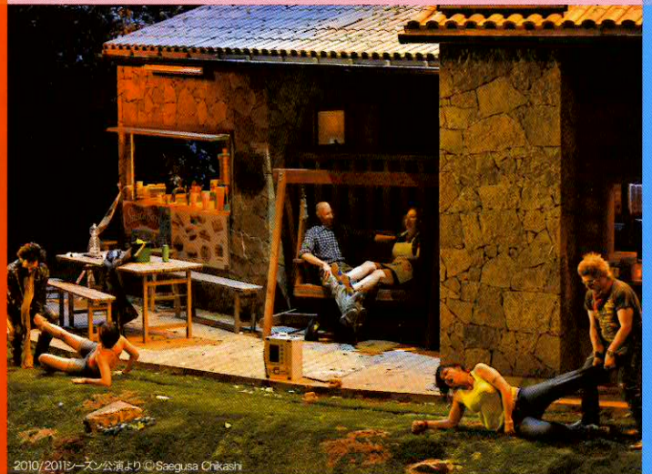
2010/2011シーズン公演より

当初フェルランド役で出演を予定しておりましたアレクセイ・クドリャは健康上の理由により、また、ドン・アルフォンソ役で出演を予定しておりましたホセ・カルボは2011年に発生した原子力災害による自身の健康への懸念から、出演できなくなりました。代わって、フェルランド役はパオロ・ファナーレが、ドン・アルフォンソ役はマウリツィオ・ムラーロが出演いたします。