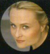
デズデーモナ マリナー・ポブラスカヤ