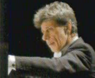
指揮 ジャン・レイサム＝ケーンニク

15世紀末、ヴェネツィアの將軍オテロがトルコ艦隊に勝利し、嵐の中キプロス島に帰還する。カッシオが副官に昇進し、それを妬む旗手のイアゴは、オテロを破滅させるべく謀略を企む。まずはカッシオを失脚させ、オテロへの取りなしを妻デズデーモナに頼むようカッシオに入れ知恵する。さらにデズデーモナの落としたハンカチを手に入れ、カッシオに持たせる。妻とカッシオの不貞を信じ込んだオテロは嫉妬に狂い、デズデーモナを絞め殺すが、真実を知り自害する。