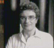
演出 マリオ・マルトーネ