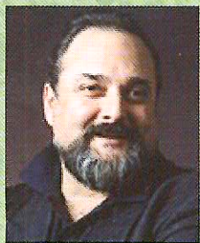
指揮 S.マストランジェロ

11月3日(日)・4日(月・祝) 13:15開場 14:00開演 新国立劇場 オペラハウス