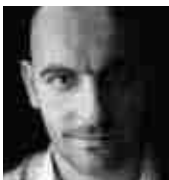
演出 ヴァンサン・ブサル