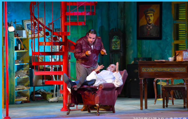
2020年公演より©寺司正彦