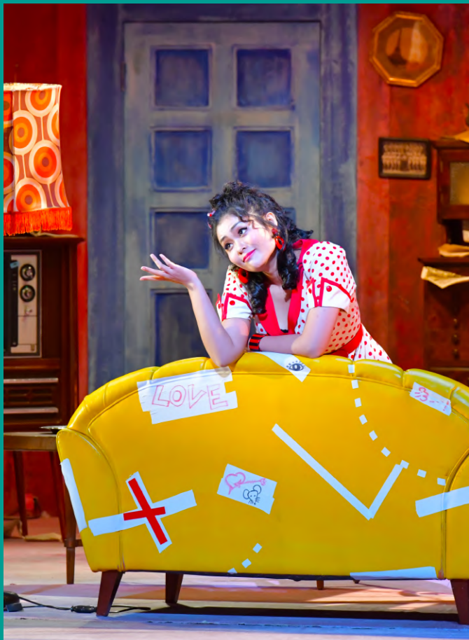
全2幕<イタリア語上演/日本語及び英語字幕付>