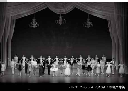
バレエ・アステラス 2016より

バレエ・アステラス委員(五十音順) 安達悦子 岡本佳津子 小山久美 小林紀子 牧阿佐美 三谷恭三