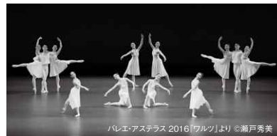
バレエ・アステラス 2016「ワルツ」より

『人形の精』組曲 日本における『セゾン・リュス (ロシアの季節)』参加作品 振付: S. レガート / N. レガート