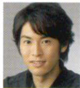
福岡雄大 Fukuoka Yudai (6日・11日)