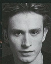
アンドレイ・ウヴァーロフ 元ボリショイ劇場 プリンシパル