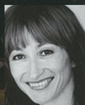
ダリア・クリメントヴァ 元イングリッシュ・ナショナル・バレエ プリンシパル