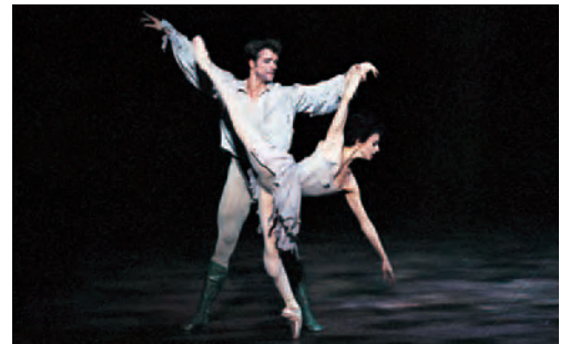
(表面・裏面共に) 2003年公演より