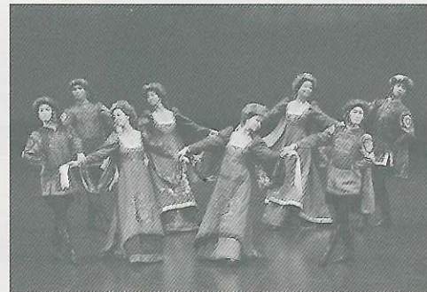
ヒストリカル・ダンス (2010年10月発表会より)

※内容・出演者等が変更となる場合がございます。あらかじめご了承ください。 ※音楽は、録音によるテープを使用いたします。