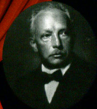
リヒャルト・シュトラウス