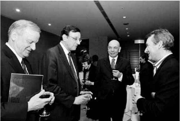
バレエ「ペンギンカフェ」初日の大使鑑賞プログラム Diplomats at the opening night for the ballet “‘STILL LIFE’ AT THE PENGUIN CAFÉ”