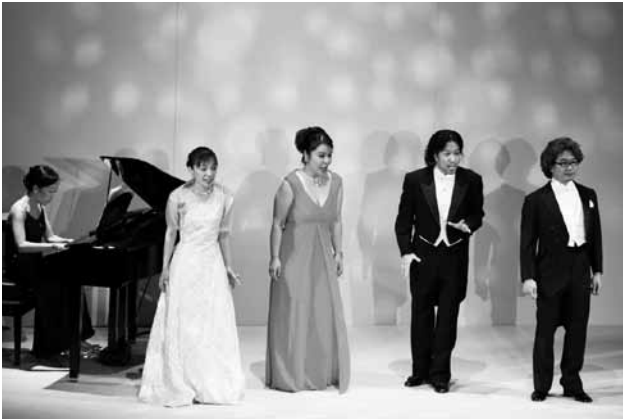
舞台美術センターコンサート「銚子!?!のいい仲間たち」 Concert at Stage Set & Design Centre

The NNTT invited diplomats (ambassadors, cultural attachés) and representatives of cultural organizations to opera and ballet premieres in an effort to promote international cultural exchange.