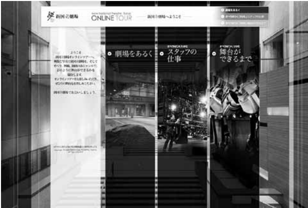
オンライン講座 現代舞台芸術入門オンラインツアー（オペラ編） Online tour (Opera edition)